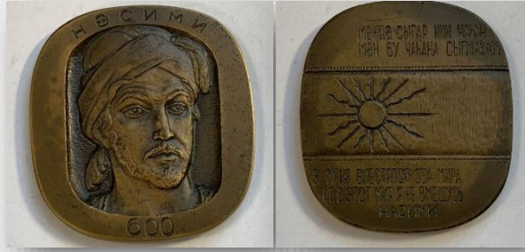
“Nəsiminin anadan olmasının 600 ili” Masaiüstü medalı (1979-cu il)