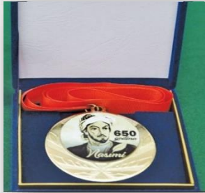
Serbiya Kral Akademiyasının 2019-cu il 20 fevral tarixli qərarı ilə təsis olunmuş medal