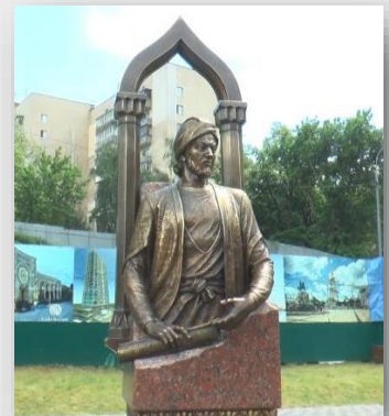
Moskvada İmadəddin Nəsiminin büstü - müəllif Mahmud Rüstəmov(2018)