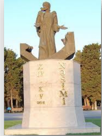
“Çənlibel” parkında inşa olunan “Saatlar qülləsi”nin qarşısında qoyulan İmadəddin Nəsiminin heykəli