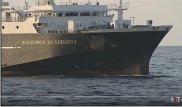
Xəzər sularında üzən “Akademik Topçubaşov” gəmisi