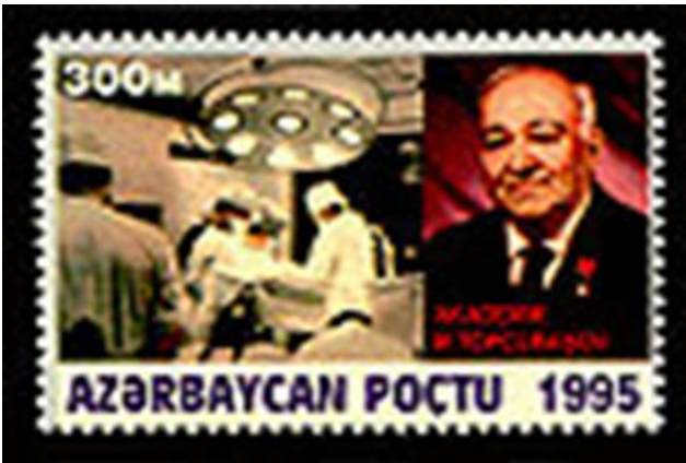
100 illik yubileyi münasibətilə buraxılan poçt markası