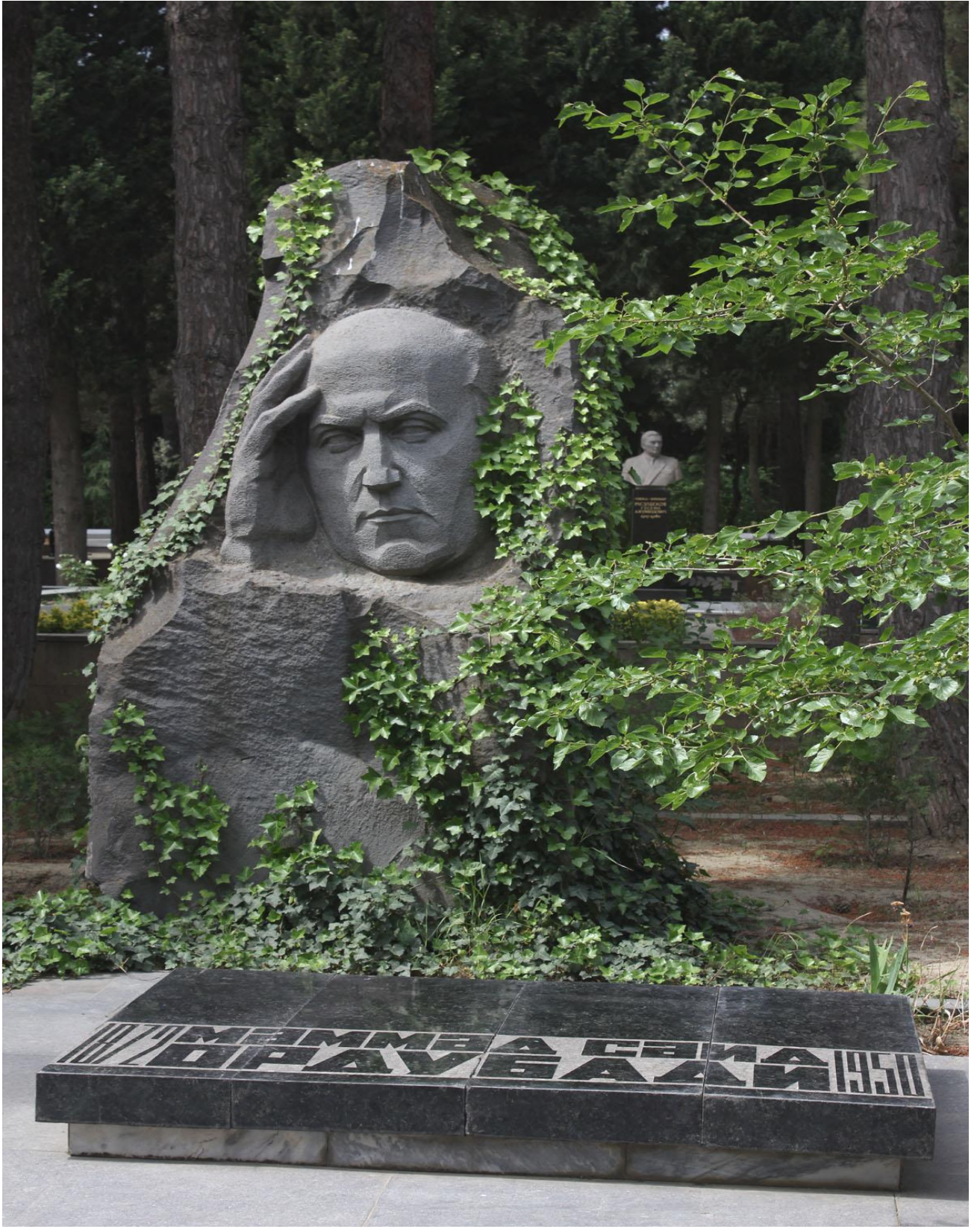
Məmməd Səid Ordubadinin Fəxri xiyabanda qəbrüstü abidəsi.