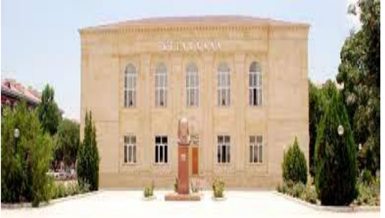
M.S.Ordubadi adına Naxçivan Muxtar Respublika Kitabxanası e-kitab.nakhchivan.az