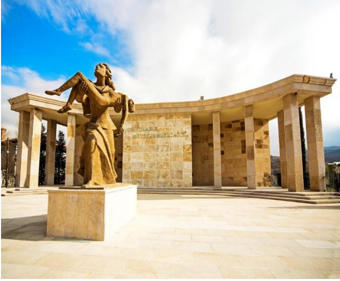
Ankara, Türkiyə 27 mart 2014-cı il