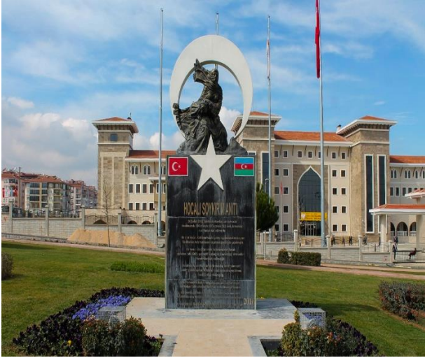
Dənizli, Türkiyə 4 noyabr 2016-cı il