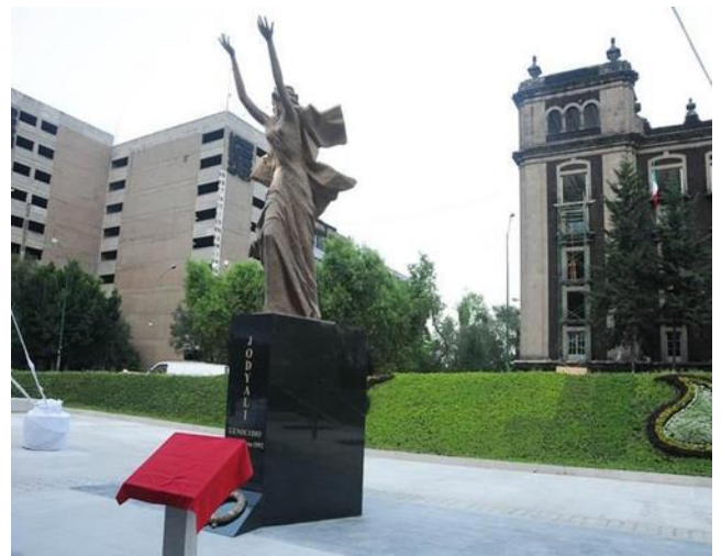
Mexiko şəhəri, Meksika Birləşmiş Ştatları 24 avqust 2012-ci il