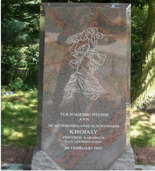
Haaqa , Niderland(24.02.2008)