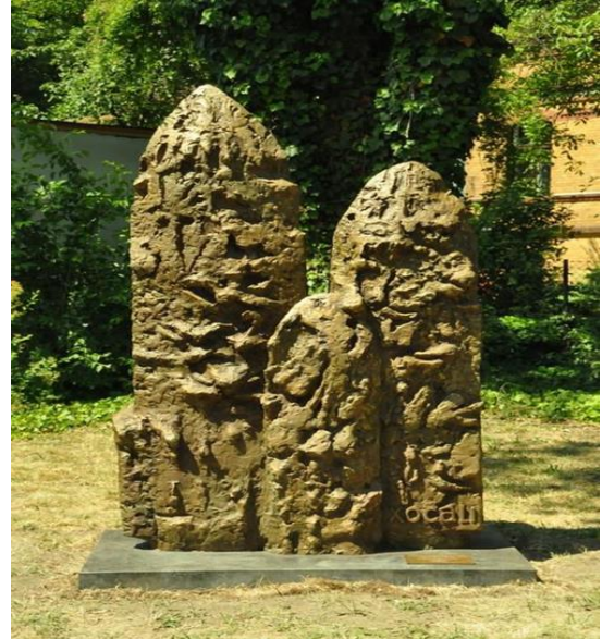
Berlin, Almaniya (30 may, 2011)