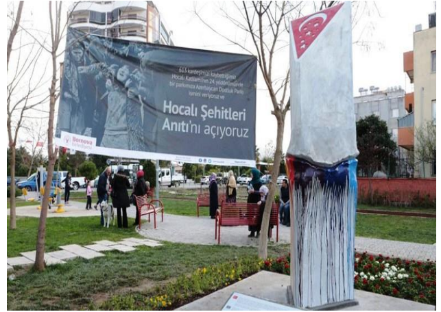
İzmir, Türkiyə 26 fevral 2016