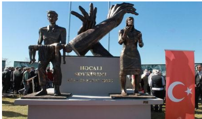
Uşak, Türkiyə 20 fevral 2014