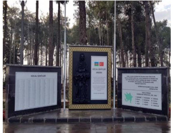
Kahramanmaraş, Türkiyə 12 fevral 2019-cu il