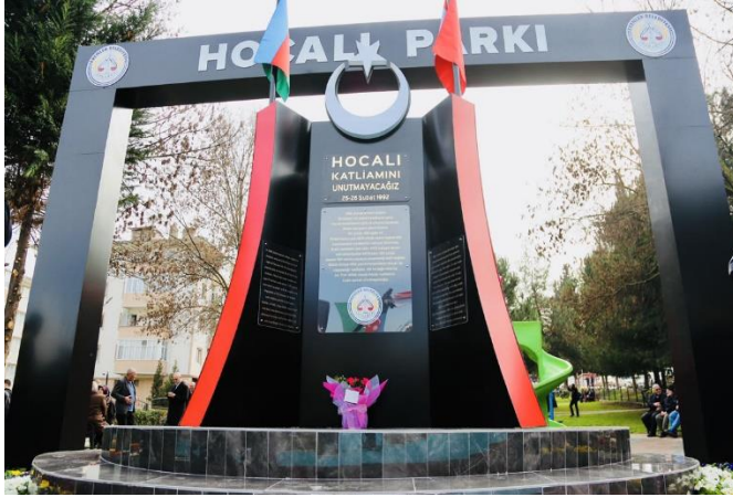
Sakarya, Türkiyə 9 fevral 2018