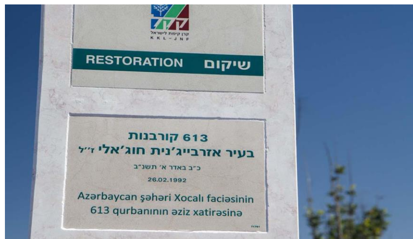
İsrail, 26 fevral 2016-cı il