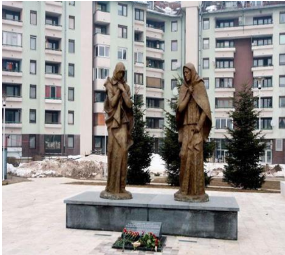
Sarayevo, Bosniya və Herseqovina (24 fevral 2012-ci il)