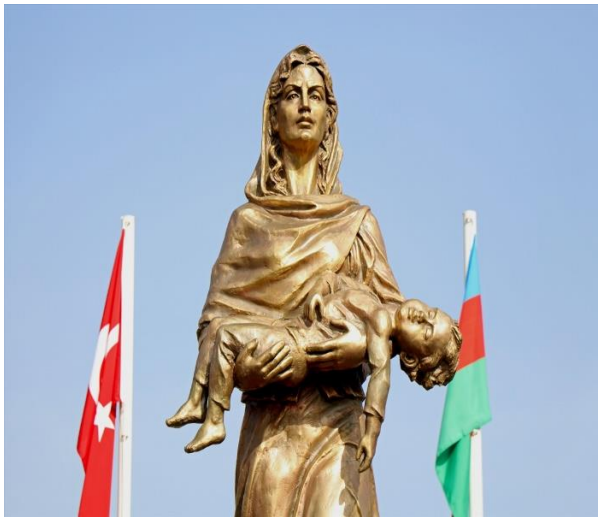
Kayseri, Türkiyə 20 oktyabr 2018-ci il