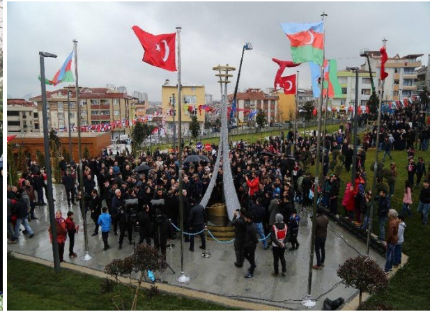
İstanbul, Türkiyə 25 fevral 2018