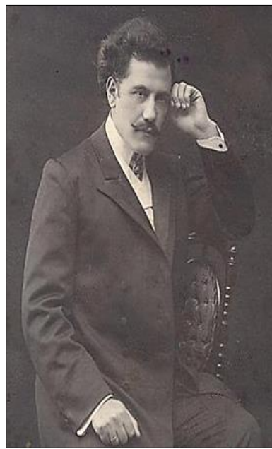
Bakıda (1908-ci il)