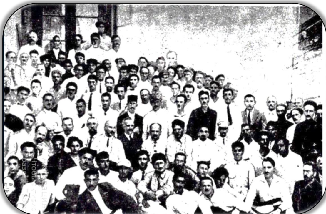
Haqverdiyev I Azərbaycan ölkəşünaslıq qurultayı nümayəndələri ilə