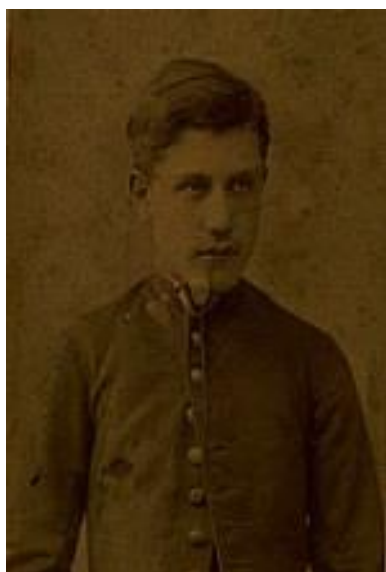
Uşaqlıq illərində Şuşada